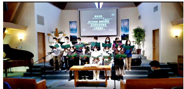
小麥子學生團契於10/31/2021主日 崇拜為主獻上詩歌「厚恩待我」